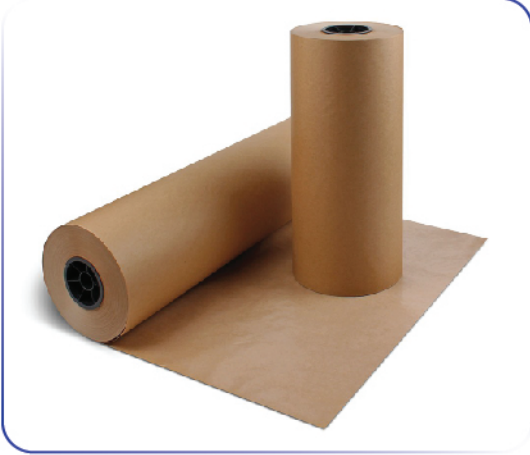
“Çantalar için Kraft Rulo”