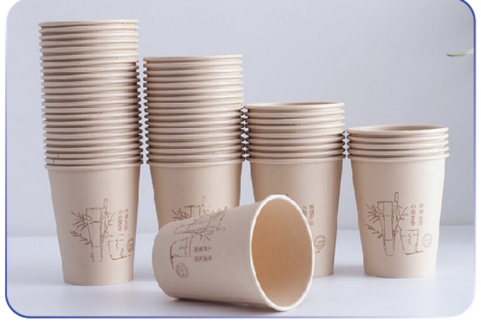
“Tek Katlı Bardaklar”